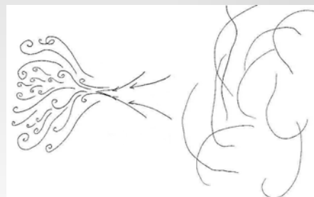
Přístroj zlepšující vzduch (Luftverbesserer)

Během přednášky se dozvíte o vnímání vlastností živých sil přírody. Seznámíte se s pojmem éterických strojů, s tzv. "Morální technikou" a technologiemi vytvořenými na základě přírodních pochodů a éterických sil.