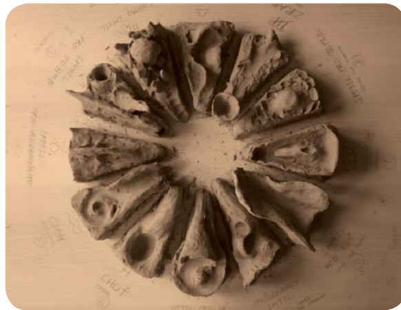
Plastika dvanácti smyslů člověka, skupinová práce pod vedením O. Hozmana