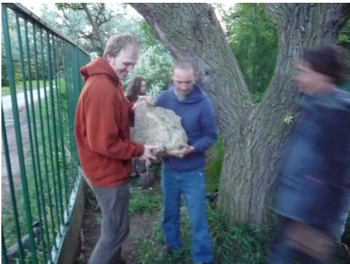
Oslava položení nárožních kamenů okolo pozemku a zahrady.