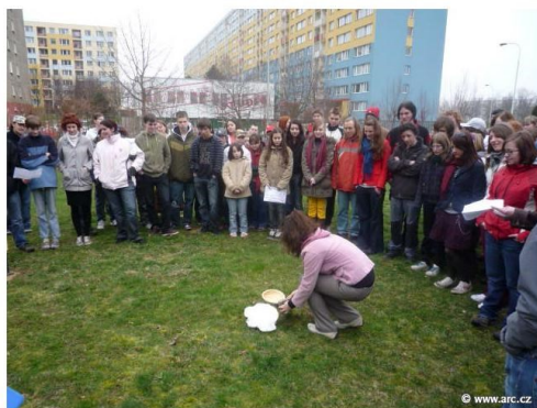
Oslava položení základního kamene zabyrady waldorfské školy.