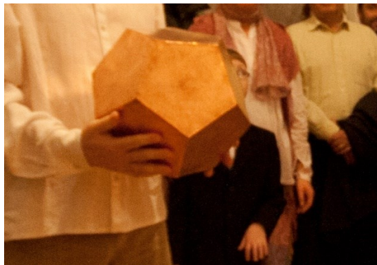
Oslava položení základního kamene.