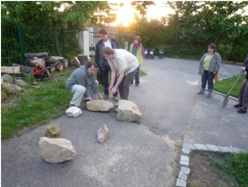
Příprava kamenů před slavnostním položením okolo pozemku ve Waldorfské škole v Praze 5 - Jinončích v roce 2009

Rituál pokládání nárožních kamenů je slavnostní lidský úkon, který člověku pomáhá oddělovat prostory a jejich bytostné podstaty. Dnes totiž již nejsme běžně schopni bytostnou podstatu činnosti trvale udržet v naší pozornosti. Pokládání nárožních kamenů pomáhá vymežit hranice záměrů, nálad a následných událostí a zážitků. Používají se také při vymezení a tvorbě dětských hřišť. Nárožní kameny mohou být viditelné a mohou na místě zůstat a tvořit výtvarné prvky na hranicích pozemků. Ve vztahu ke světu elementárních bytostí stačí, když kameny leží na místě tři dny.